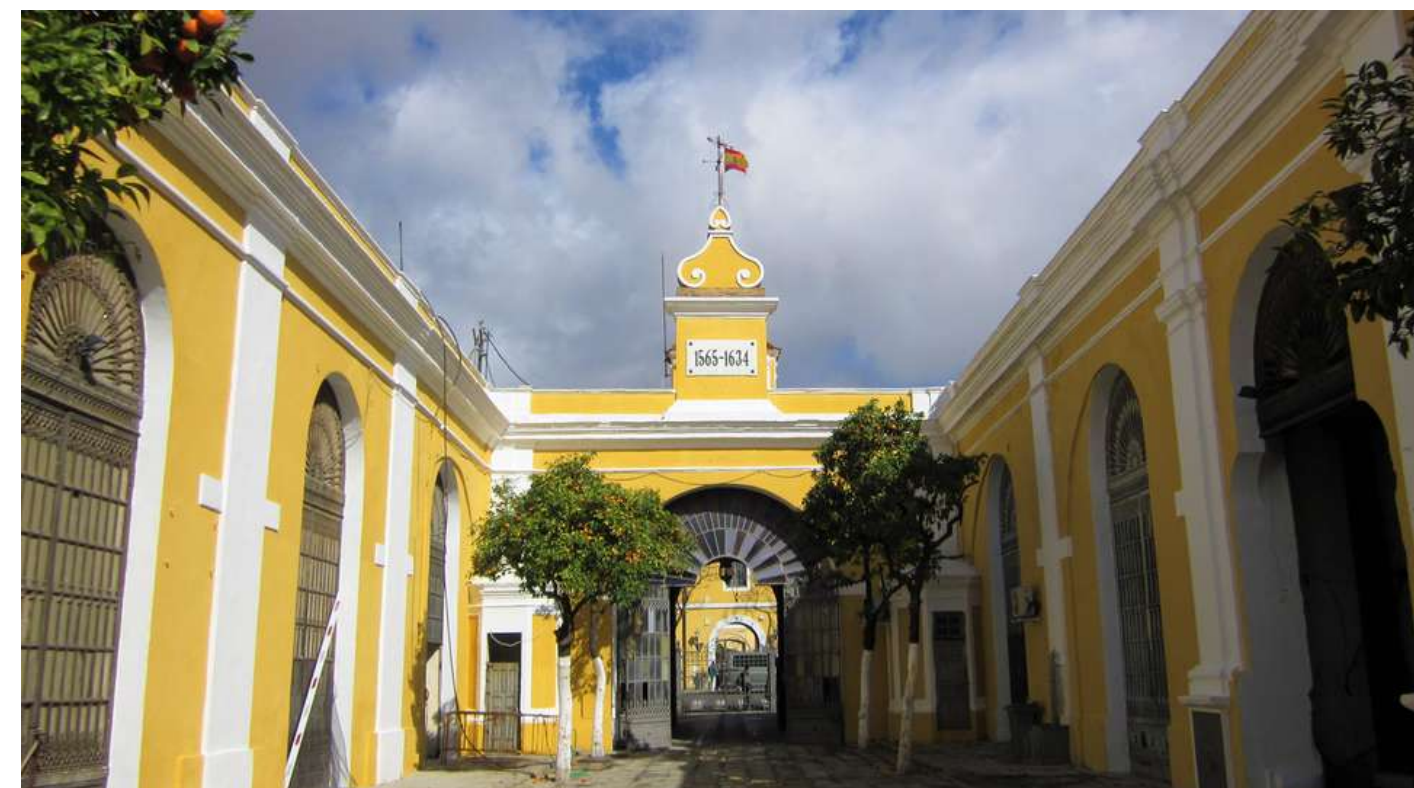
CONSULTORÍA REHABILITACIÓN PASSIVHAUS EN EDIFICIO HISTÓRICO - REAL FÁBRICA DE ARTILLERÍA SEVILLA: C&A

CONSULTORES Y DISEÑADORES PASSIVHAUS: CASTAÑO&ASOCIADOS 1º BLOQUE PLURIFAMILIAR PRECERTIFICADO PH EN ANDALUCÍA