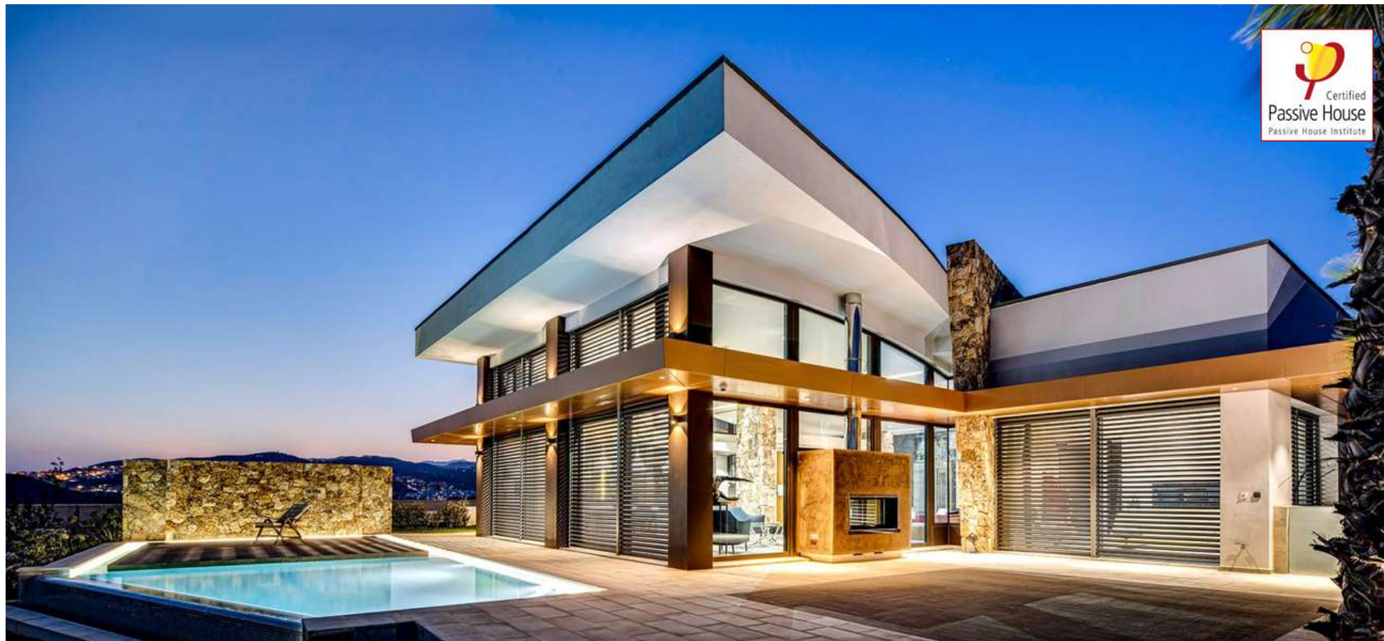
THE WAVE HOUSE (VILLA DE LUJO CERTIFICADA) Arquitectura: CACOPARDO Architects CONSULTORES Y DISEÑADORES PASSIVHAUS: CASTAÑO&ASOCIADOS PASSIVHAUS

Empresa de arquitectura, ingeniería, consultoría y formación especializada en edificaciones de consumo casi nulo bajo estándar Passivhaus. Con 40.000 m 2 realizados de consultoría Passivhaus . Especializados en edificios pasivos en climas cálidos . Además somos empresa de formación oficial acreditada por el PHI y la Plataforma PEP.