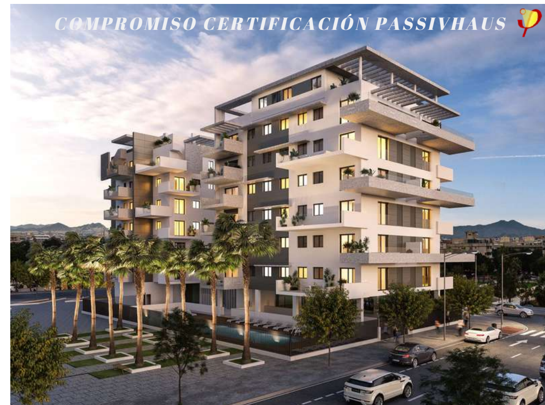
URBANLITORAL - PROMOCIÓN 44 VIVIENDAS | EXXACON

Empresa de arquitectura, ingeniería, consultoría y formación especializada en edificaciones de consumo casi nulo bajo estándar Passivhaus. Con 40.000 m 2 realizados de consultoría Passivhaus . Especializados en edificios pasivos en climas cálidos . Además somos empresa de formación oficial acreditada por el PHI y la Plataforma PEP.