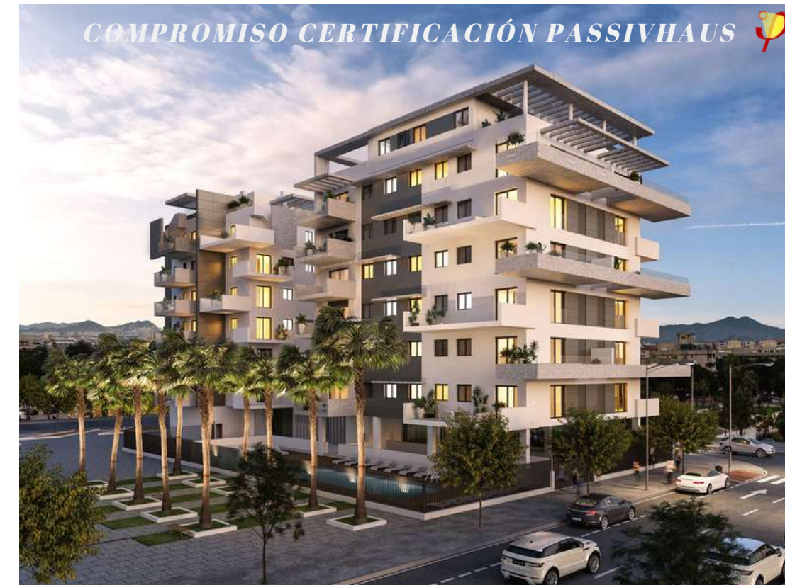
URBANLITORAL - PROMOCIÓN 44 VIVIENDAS | EXXACON

Empresa de arquitectura, ingeniería, consultoría y formación especializada en edificaciones de consumo casi nulo bajo estándar Passivhaus. Con 40.000 m 2 realizados de consultoría Passivhaus . Especializados edificios pasivos en climas cálidos . Además somos única empresa andaluza de formación oficial acreditada por el PHI