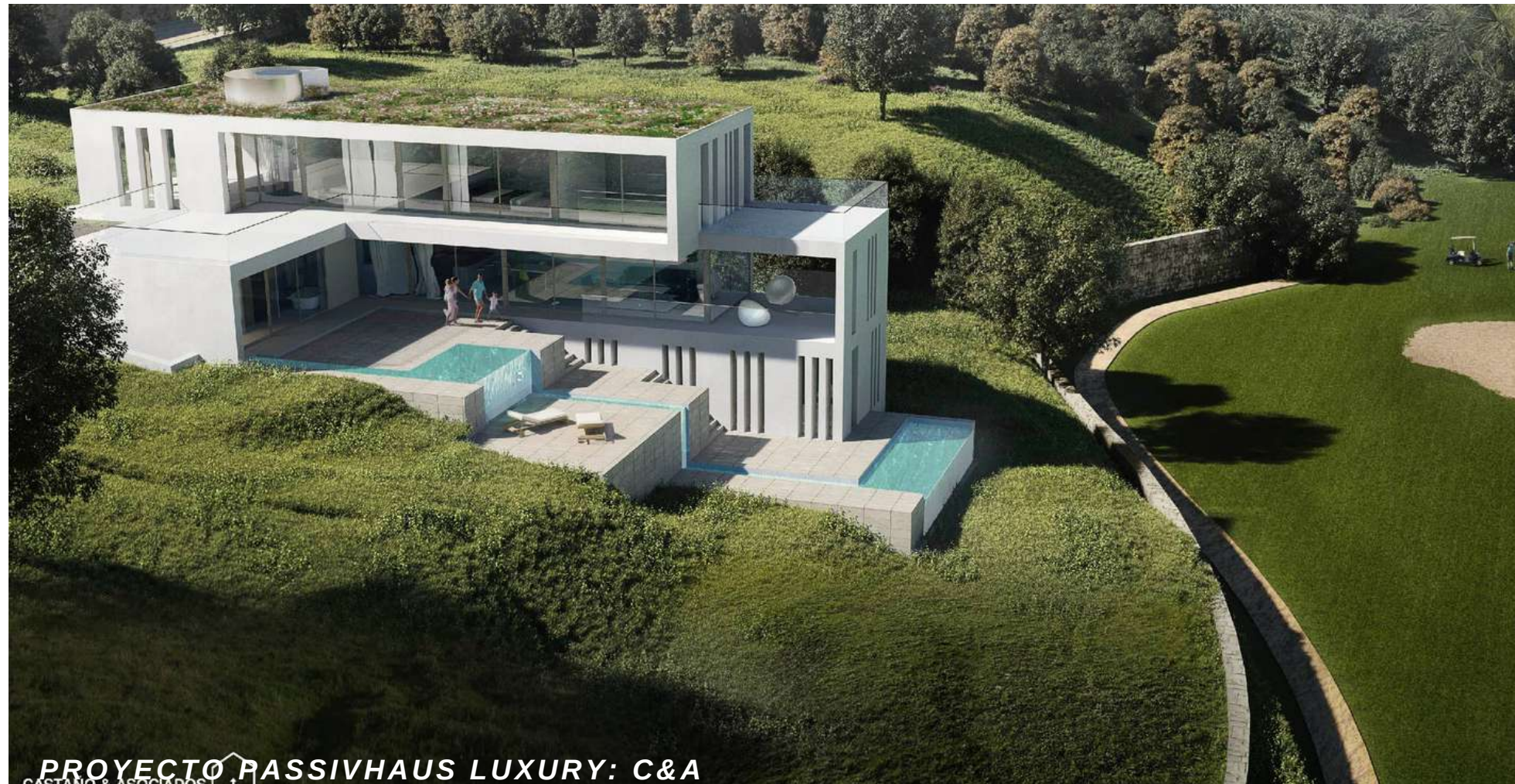
PROYECTO PASSIVHAUS LUXURY: C&A

Empresa de arquitectura especializada en edificaciones de consumo casi nulo. Con 30.000 M 2 realizados de consultoría passivhaus . Especializados casas pasivas para climas cálidos . Además somos empresa de formación acreditada por el PHI