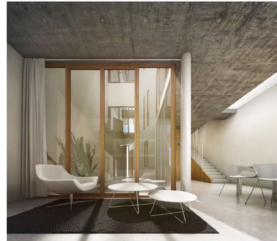
PATIOHAUS, TRADICIÓN Y EFICIENCIA: C&A

Empresa de arquitectura especializada en edificaciones de consumo casi nulo. Con 30.000 M 2 realizados de consultoría passivhaus . Especializados casas pasivas para climas cálidos . Además somos empresa de formación acreditada por el PHI