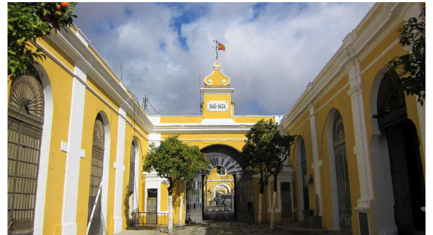
CONSULTORÍA PASSIVHAUS EN EDIFICIO HISTÓRICO: C&A