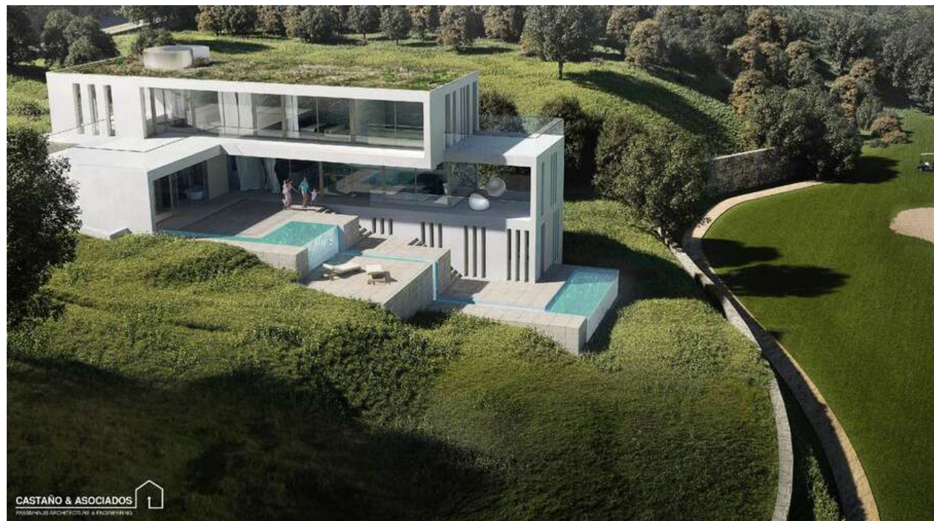
PROYECTO PASSIVHAUS LUXURY: C&A

Este curso está organizado en conjunto por la empresa de ventilación Siber y el Clúster de la Construcción Sostenible de Andalucía .